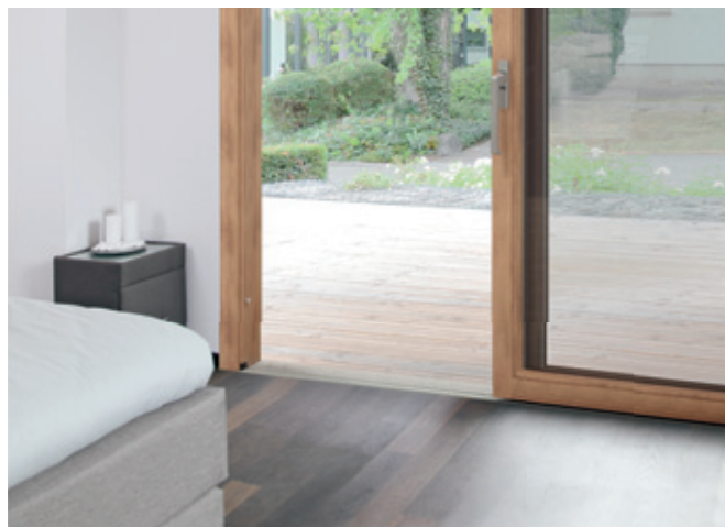
Hebeschiebeelement (Holz) mit GU-thermostep barrierefrei