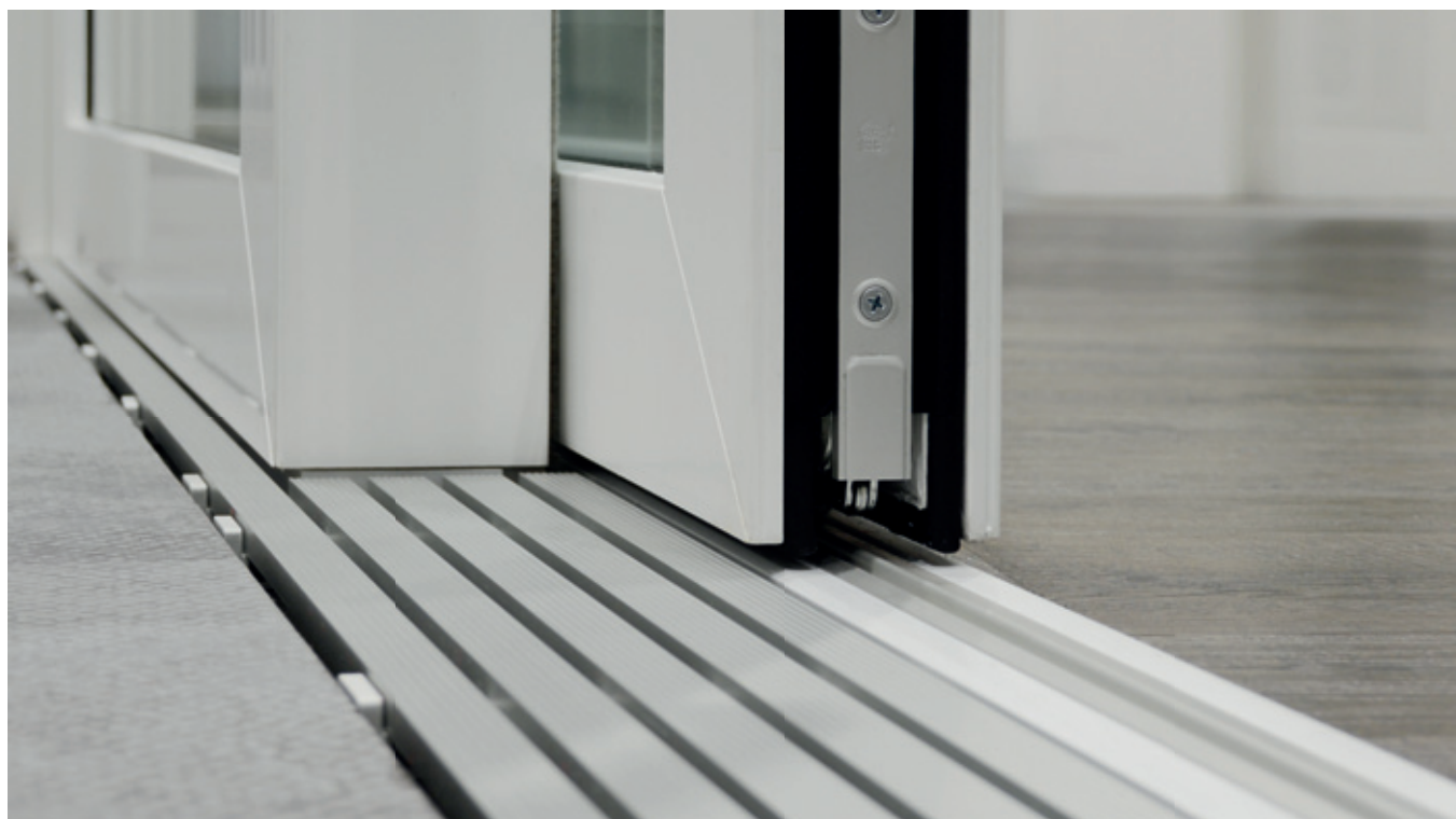
Hebeschiebeelement (Kunststoff) mit GU-thermostep barrierefrei