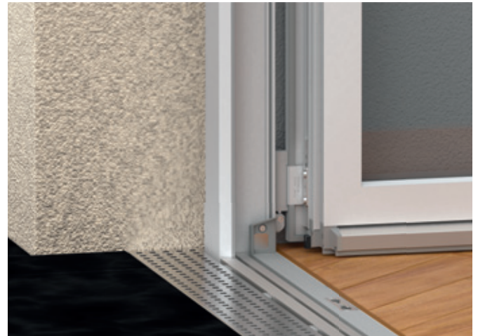
Fenstertür mit GU-Systembodenschwelle barrierefrei