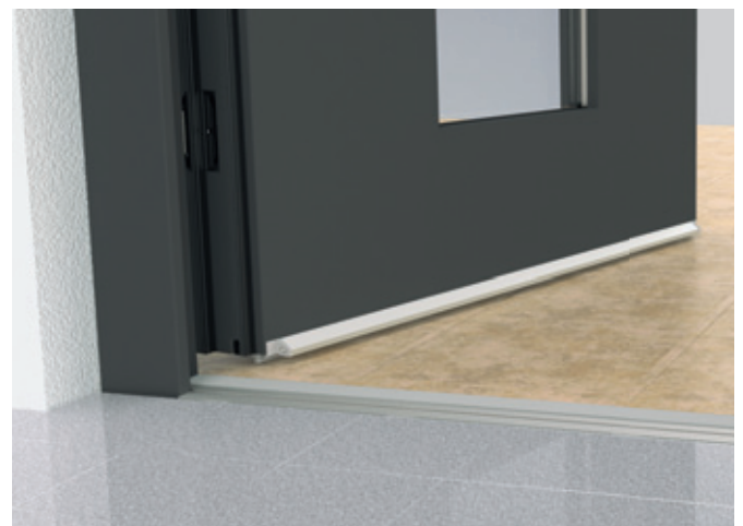
Haustür mit GU-Systembodenschwelle barrierefrei